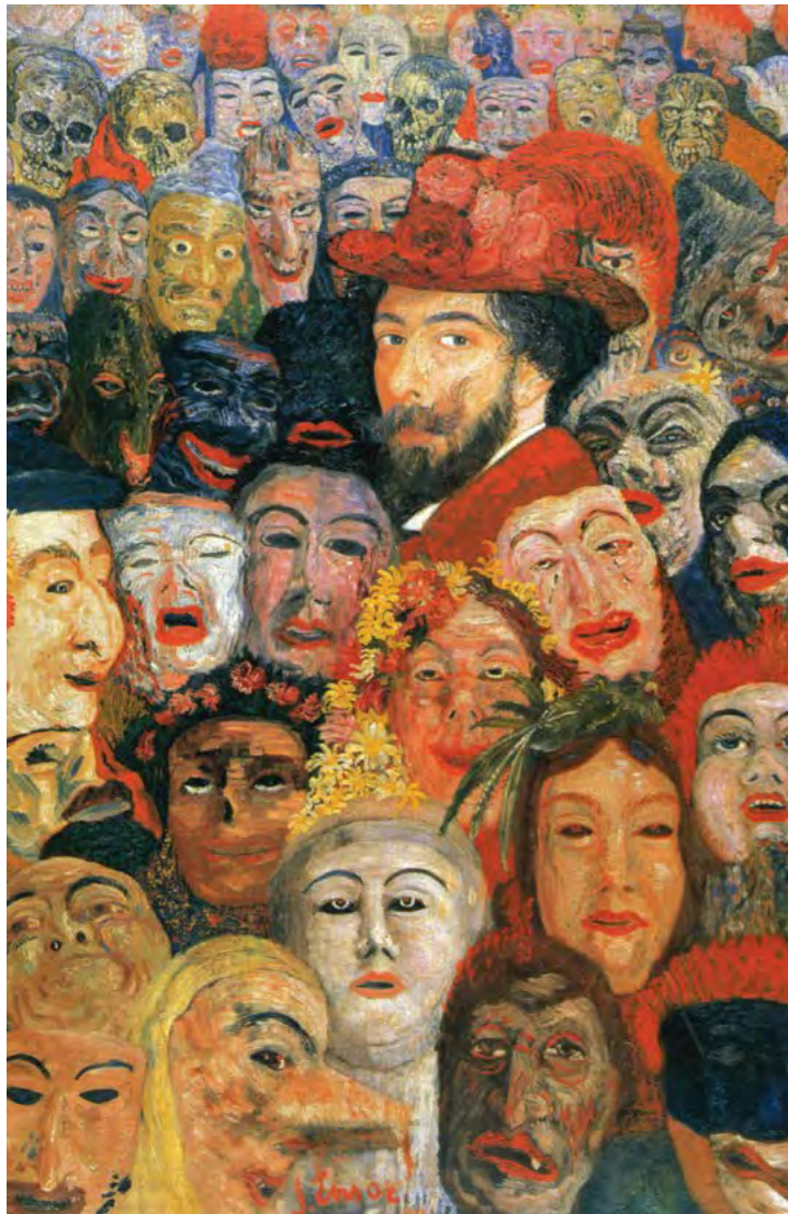
James Ensor, Mijn portret omringd door maskers, 1899 olieverf op doek, 120 x 80 cm Menard Art Museum, Aichi (Japan)