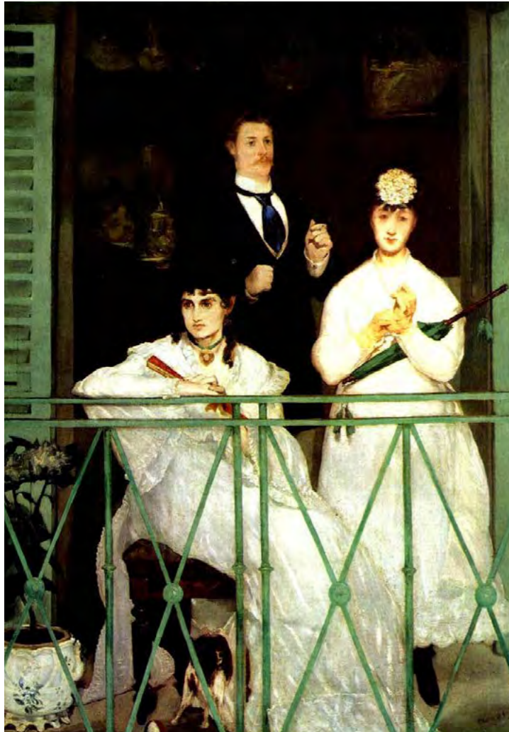
Edouard Manet, Het Balkon, 1868/1869 olieverf op doek, 170 x 125 cm, Musée d'Orsay, Parijs