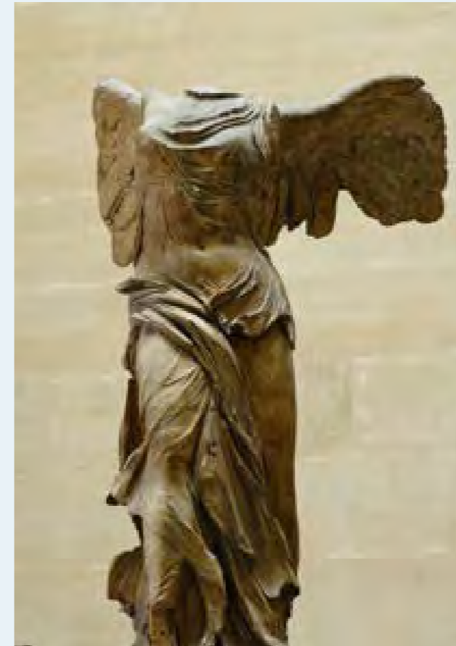
Nike van Samothrace, ca. 190 v.Chr.

Mensen sporten, vechten om hun vrijheid, vertellen fantastische verhalen, bouwen de mooiste tempels en maken perfecte beelden. Alles in de klassieke oudheid wordt geïdealiseerd. Ook het mensbeeld. De beelden van mensen zijn volmaakt geproportioneerd, de verhoudingen zijn in harmonie en de beheersing van het materiaal is weergaloos. De mens streeft naar het goddelijke: net zoals de goden weleens in mensen veranderen, willen de mensen goddelijk zijn. Ook de kunstenaar probeert zichzelf te overtreffen en beelden te scheppen waarin je de volmaaktheid van de mens kunt zien. Menselijke beelden krijgen zo iets goddelijks.