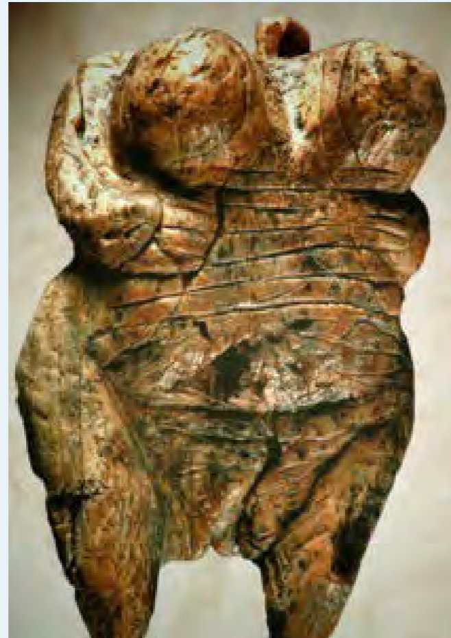
Venus van de Holle Rots, ca. 35.000 tot 40.000 jaar geleden.

De vrouw heeft geen hoofd. Het accent ligt op de vooruitstekende borsten, de brede heupen en de schaamstreek. Daardoor moeten we niet gelijk aan een pin-upmodel of een ordinaire pornografische voorstelling denken. Voedsel, vruchtbaarheid en voortplanting zijn de primaire levensvoorwaarden van onze prehistorische voorouders. Op een primitieve en expressionistische manier laat dit beeldje dat zien.